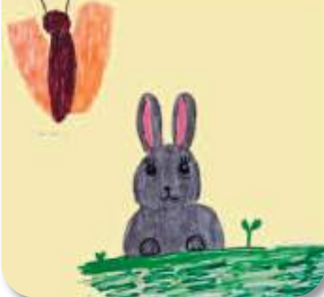
Il coniglietto e la farfalla

Un piccolo coniglietto sbucò con il musetto e c'era anche una farfallina che fece la rima. Vicino al ruscello, un asinello ragliava felice ma se ne andò' sul più bello. Tutti gli animali si unirono in coro, per finire questo capolavoro.