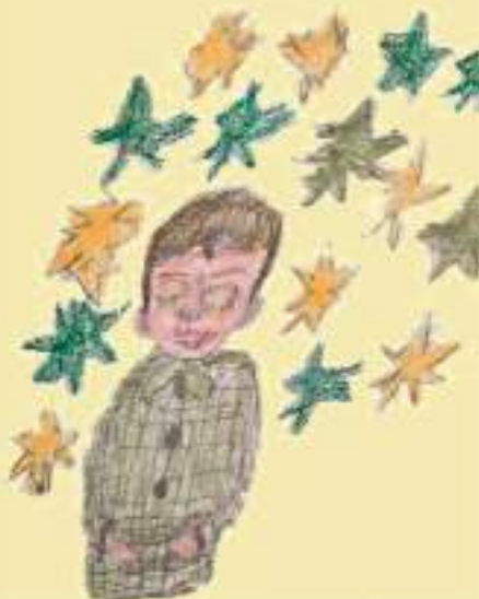
Il bambino "Non Sbaglierò"

Raccolse le foglie e ne fece coperta, cercò un posticino... e fu felice sino al mattino.