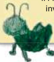
Il Grillo parlante