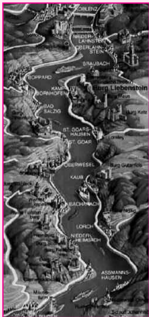
La mappa dei castelli nella Valle del Reno