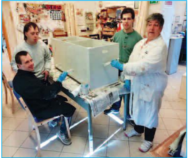
Laboratorio del nuovo Anffas Point in via Lamarmora

Tra tanti guai, sono proprio gli attestati di stima dei nostri "ragazzi" a darmi sempre forza e fiducia nel futuro della nostra Associazione. ■