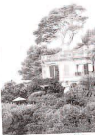
Villa Altachiarà, l'ex residenza della contessa Vacca Augusta