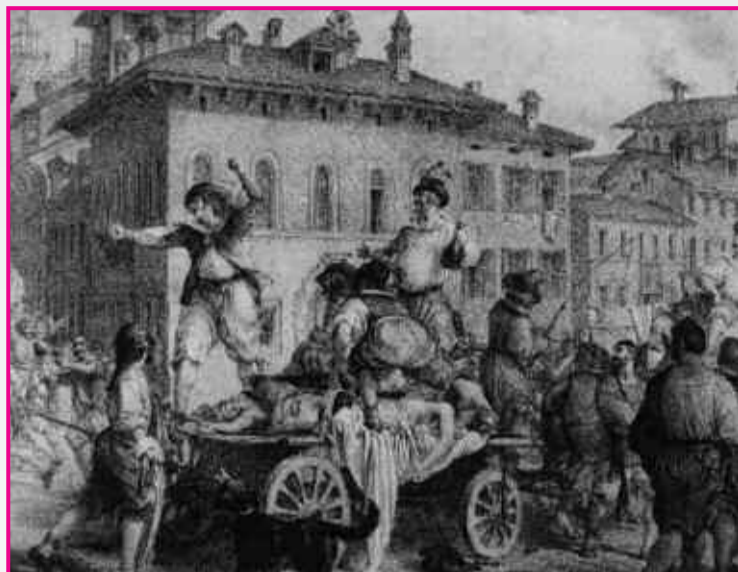
G. Gallina "Renzo sul carro dei monatti"

Certamente le disposizioni ministeriali, che negano l'ingresso nelle scuole pubbliche ai